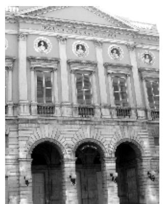
Teatro Comunale «Curci»