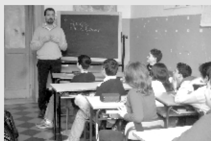
Una lezione con il lettore

Durante le lezioni conversiamo su temi vicini alle nostre esperienze ed alle nostre conoscenze linguistiche: si parla