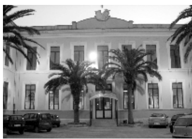
Scuola «A. Manzoni»

Ore 8.10 Scuola Secondaria di I Grado «A. Manzoni»: il suono della campanella si fa sentire nell'ampio cortile che ci ospita prima del via delle lezioni. Inizia una nuova giornata di studio, che noi alunni ci prepariamo ad affrontare in modo energico.