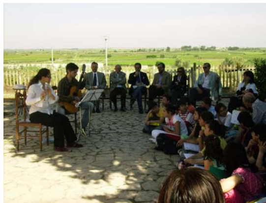
Un momento di serenità e di distacco dal caos della vita quotidiana

Il progetto consiste nell'organizzare incontri nella stazioncina di Canne della Battaglia, in cui si alternano momenti di silenzio a momenti di riflessione su brani poetici o ascolto di musica classica eseguita da musicisti di comprovata esperienza.