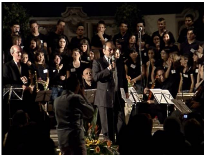
Il Concerto di Primavera

popolazione: il "CONCERTO DI PRIMAVERA", patrocinato dal Comune, ha ormai alle spalle più di dieci edizioni.