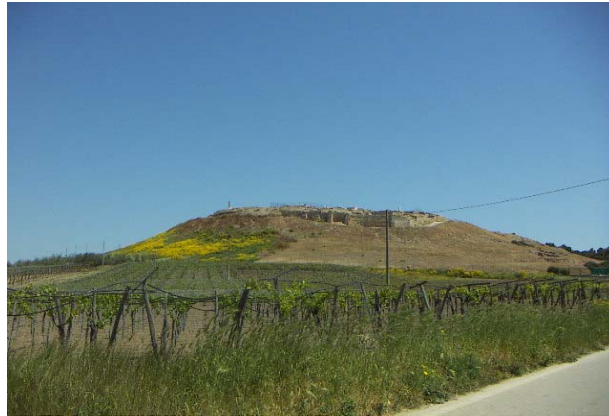
Una veduta panoramica di Canne della Battaglia

Il progetto consiste nell'organizzare incontri nella stazioncina di Canne della Battaglia, in cui si alternano momenti di silenzio a momenti di riflessione su brani poetici o ascolto di musica classica eseguita da musicisti di comprovata esperienza.